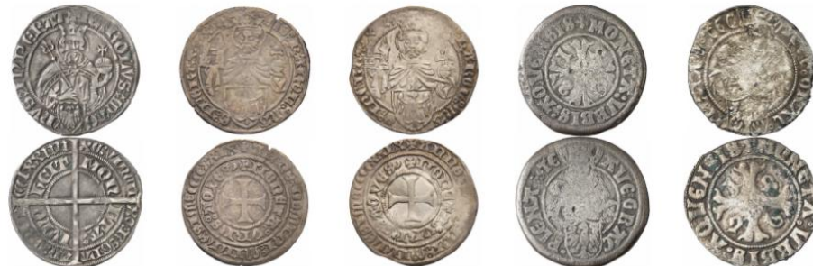
Aachen: Stadt 18206308